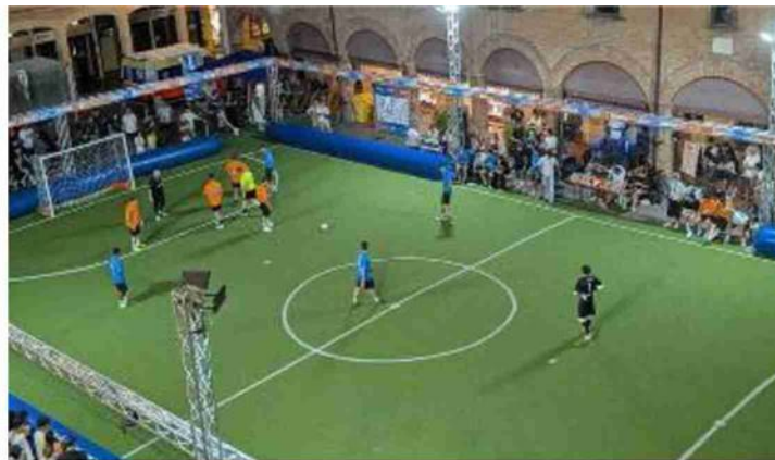
Una veduta dall'alto del campo allestito in piazza Guercino