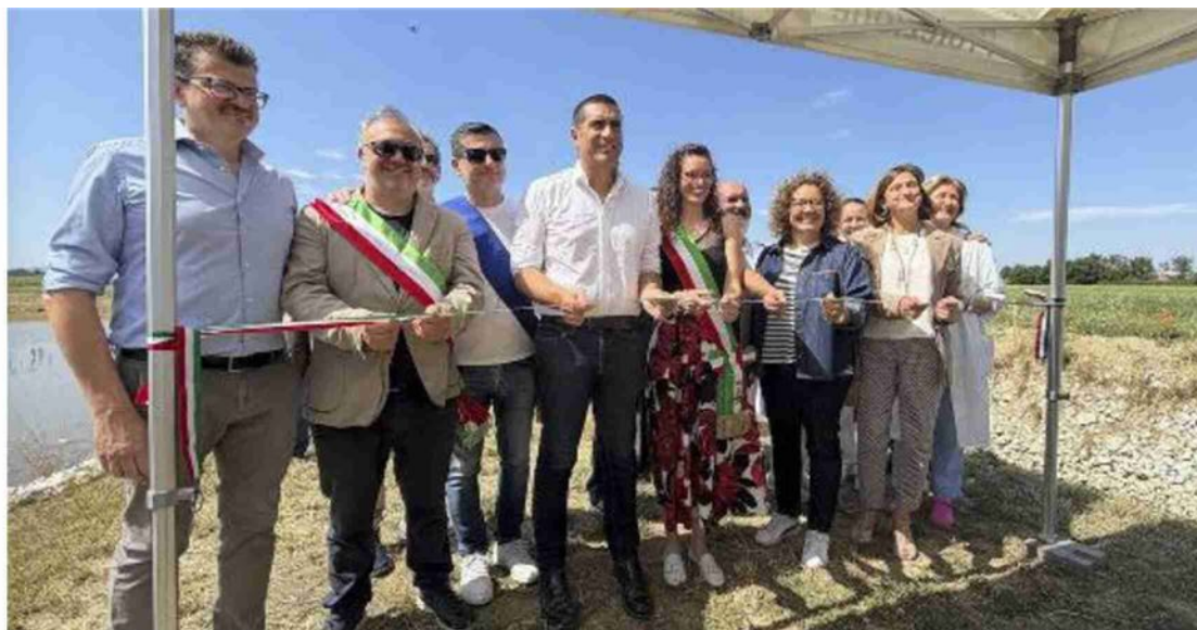
Il taglio del nastro della cassa di espansione con il governatore Michele de Pascale e i sindaci del territorio