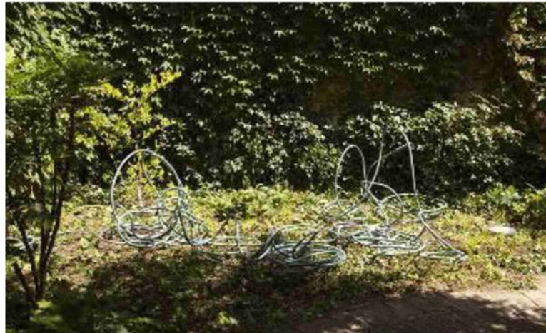
'I Have Imagined Things Only True Believers Can See', un nuovo lavoro di Mario García Torres realizzato per Palazzo Bentivoglio