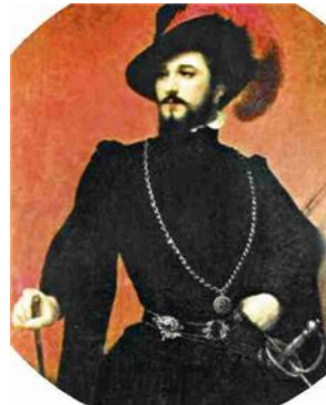
➤ Ritratto del cantante Giovanni Matteo Mario (1810-1883) nei panni di Don Giovanni