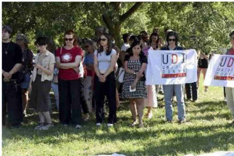
La camminata per dire basta ai femminicidi