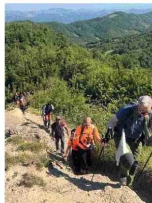
In alto, l'arrivo del gruppo alla Faggiola. In basso il passaggio alle Scalacce.