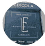
L'insegna dell'edicola tabaccheria Leuratti

L'aspetto più significativo, come confermato in questi mesi da tanti altri edicolanti, è proprio l'aspetto umano: «Noi siamo di Giandeto e giochiamo in casa, anche perché ci conosciamo praticamente tutti ed è un piacere servire le persone con cui siamo in confidenza. Gestire tutti gli impegni non è semplicissimo – conclude – ma facciamo questo lavoro con passione e guardiamo al futuro con positività». ●