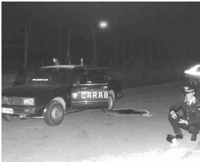
I carabinieri Cataldo Stasi e Umberto Erriu furono uccisi a Castel Maggiore nel 1988