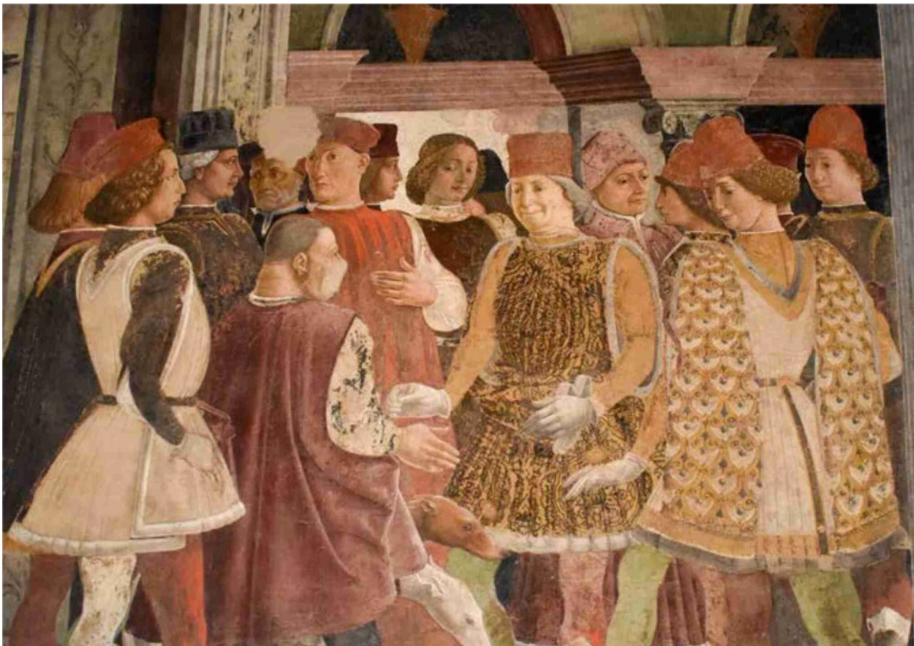
Il duca Borso con il suo buffone mascherato e i gentiluomini della sua corte Sotto: Vincenzo dal Cossa, decorazione della parete est del salone dei Mesi di Palazzo Schifanoia, Ferrara 1470.

della signoria Pio su Carpi acquistandola per centomila ducati d'oro, come ricorda ai posteri Paolo Giovio nella sua "La vita di Alfonso da Este duca di Ferrara": Fece ancora Cesare un altro gran beneficio ad Alfonso donandogli il castel di Carpi del quale aveva litigato sì lungamente esso, Alfonso, con Alberto Pio. E lo investì con grandissimi privilegi della legittima e giuridica possessione di quello, per essere caduto delle ragioni del feudo Alberto, il quale accostandosi alla parte francese, era stato condannato d'aver offeso la Maestà Imperiale. E per questa benignità, mandò Alfonso a donare in nome di mancia, centomila ducati al fisco di Cesare.