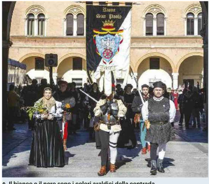
↑ Il bianco e il nero sono i colori araldici della contrada

spiegate testimonia in maniera evidente la stretta connessione delle fortune del popolo ferrarese con le capacità politiche dei principi di Casa d'Este.