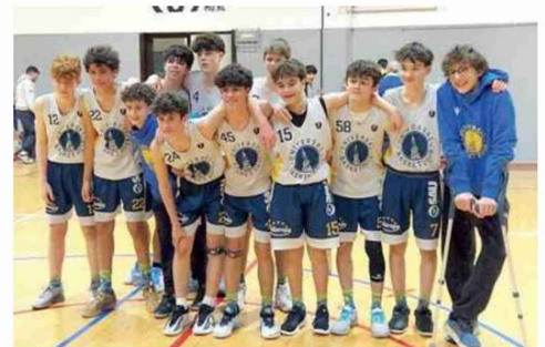
L'Universal Modena (Under 14)