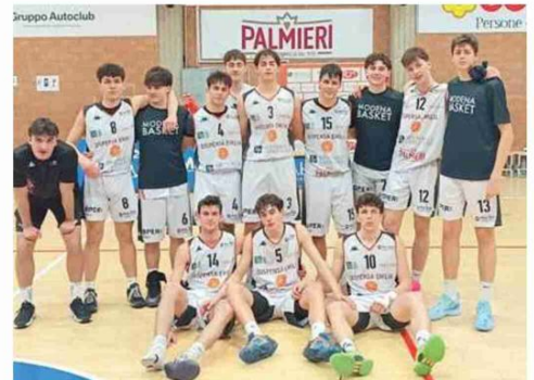
Il Modena Basket (Under 19 Gold)