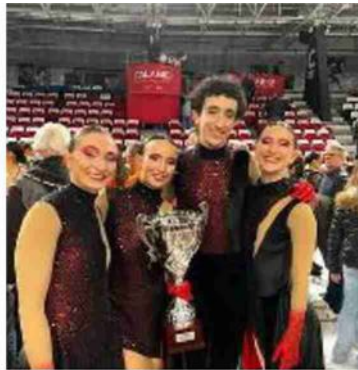
Trionfo storico per il team

una collaborazione vincente tra Sincro Roller Calderara e Pattinatori Estensi Ferrara consolidata nel tempo: un progetto condiviso che dimostra come lo sport sappia unire competenze, energie e visioni, andando oltre i colori di una singola società per costruire qualcosa di grande. Fondamentale il lavoro dello staff tecnico e degli allenatori del Calderara, il cui impegno quotidiano ha reso possibile il raggiungimento di questi traguardi. Pattinatori Estensi e Sincro Roller sono pronti a continuare il proprio percorso di crescita.