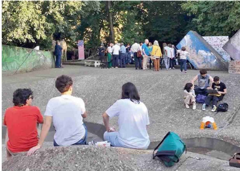
Parte il cantiere da 270mila euro, il giardino quest'estate sarà chiuso

cura dal 1998, organizzerà una festa di "arrivederci a dopo l'estate" per bambini, famiglie e studenti. ➔ a pagina 3