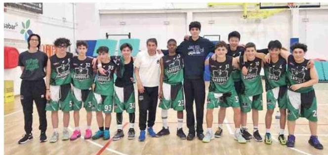
Il Sassuolo (Under 15)