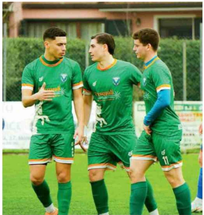
Il Masi Torello Voghiera vuole rovinare la festa promozione alla Valsanterno