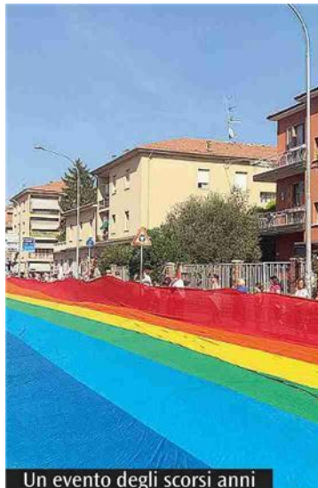
Un evento degli scorsi anni