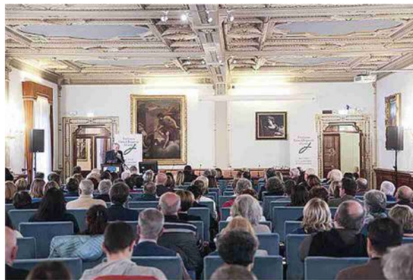
Un momento dell'incontro