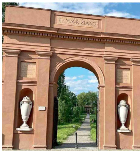
L'ingresso del Mauriziano, luogo del cuore di Ariosto