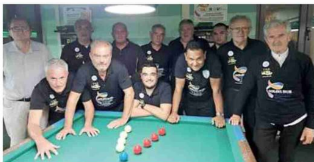
La Colordue Texmaster che sta dominando il torneo di serie C