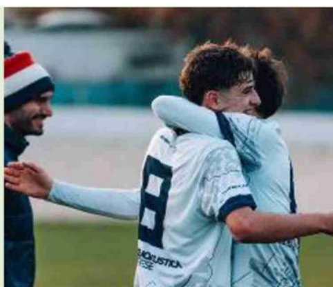
Momento esaltante per la Centese

contro il Faro Gaggio Montano: bravi e determinati i 'torelli' a riacciuffare negli istanti finali una partita che sembrava ormai persa. Per il Masi è un punto che non cambia molto in termini di classifica, ma che può ridare morale e fiducia al gruppo per affrontare le prossime partite. Il Gallo va vicino al successo sul campo della Dozzese, ma alla fine deve accontentarsi di un pari. Nel prossimo turno spicca la sfida tra Centese e Msp, mentre il Gallo ospiterà la Valsanternò.