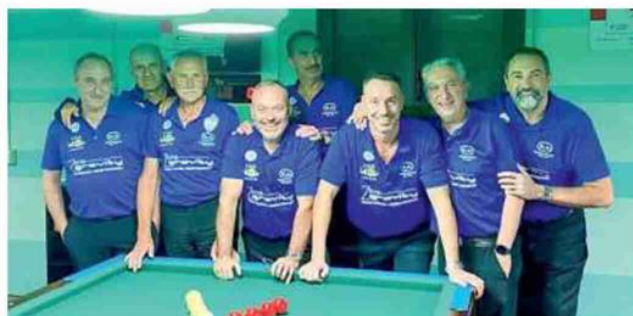
La Zero Gravity Texmaster che milita nel campionato di serie B

campo della Casarini Srl La Cantonese mantiene un margine ampio in vetta. A inseguire, staccato di tredici punti, c'è Montalto Bar Sport, che consolida il secondo posto grazie al successo per 4-2 su Bar Skiplly Felina. Il turno sorride anche a Conad Le Colline Buco Magico, vittoriosa per 5-1 su Bentivoglio Centro Sociale Olimpia, e a Sant'Ilario Val d'Enza, che supera 4-2 La Rocca Texmaster. Vittoria larga anche per Centro Sociale Orologio, che si impone 5-1 su Carrozzeria Prandi Massenzatico. ●