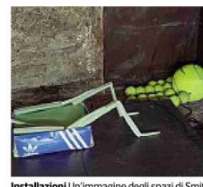
Installazioni Un'immagine degli spazi di Smith