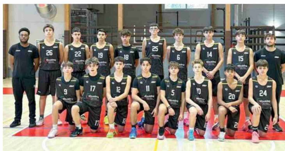
Nella foto la squadra dell'Under 15 Gold della Scuola Pallavolo Vignola

Under 14 Regionale, I Fase, Girone A, 12.a giornata: F.Francia Zola-FBK Fiore 62-47, Magik Rosa Pr-Sisters Piumazzo 65-36, Puianello-Pr Bk Project 118-22. Rip. Ira Tenax Cortemaggiore. Classifica: Puianello**, F.Francia 16; FBK Fiore 14; Magik Rosa* 10; Ira Tenax* 6; Pr Bk Project* 4; Sisters* 0. *=1 partita in meno.