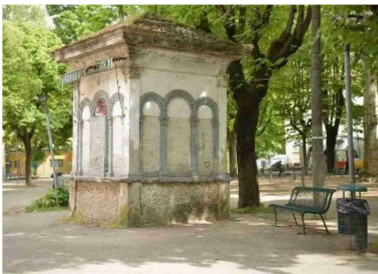
Uno scorcio del quartiere in una delle immagini che saranno esposte in strada

Saranno esposti 30 scatti degli allievi dell'Accademia di Belle Arti