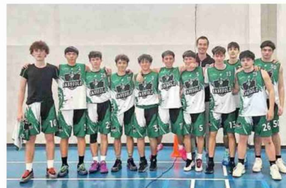
Nella foto la formazione Under 13 del Castelfranco Emilia