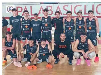
Nella foto la squadra dell'Under 19 Gold MoBa Modena a Basiglio