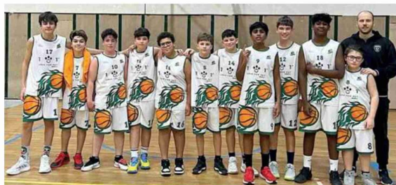
Nella foto la formazione Under 19 Gold Mo.Ba Modena a Basiglio