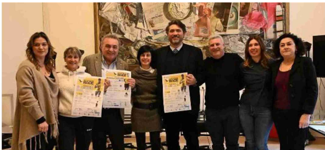
I protagonisti della presentazione della Interporto Race nella sala Luca Savonuzzi di Palazzo d'Accursio