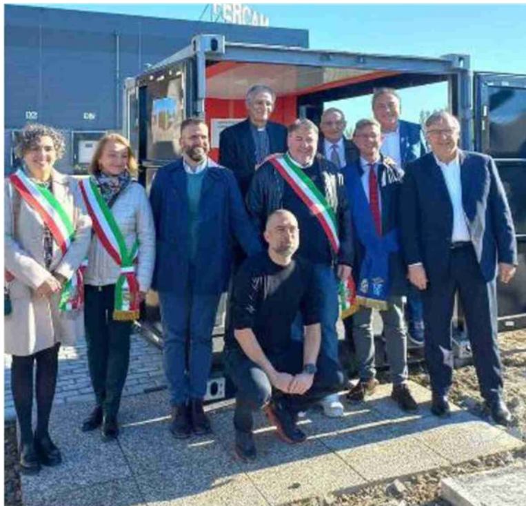
Il cardinale Zuppi all'Interporto