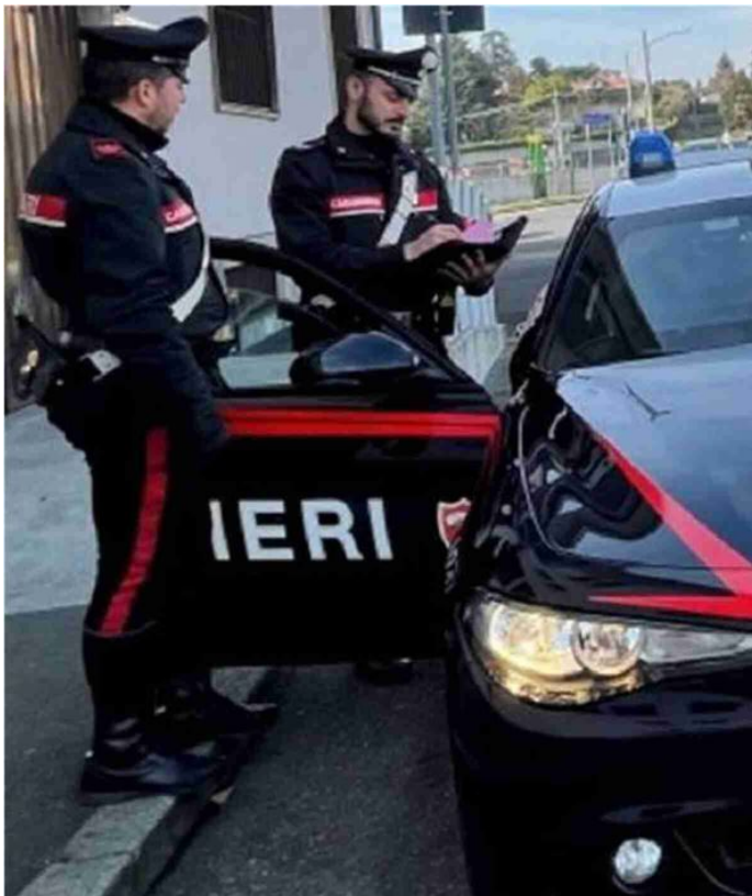
I carabinieri hanno fermato l'uomo mentre stava tentando di entrare in una panetteria

Era già gravato dalle misure cautelari dell'obbligo di dimora e di presentazione