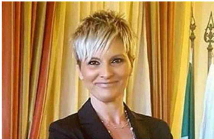
Il sindaco di San Clemente. Mirna Cecchini