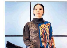
▲ La collezione "Free-volo"