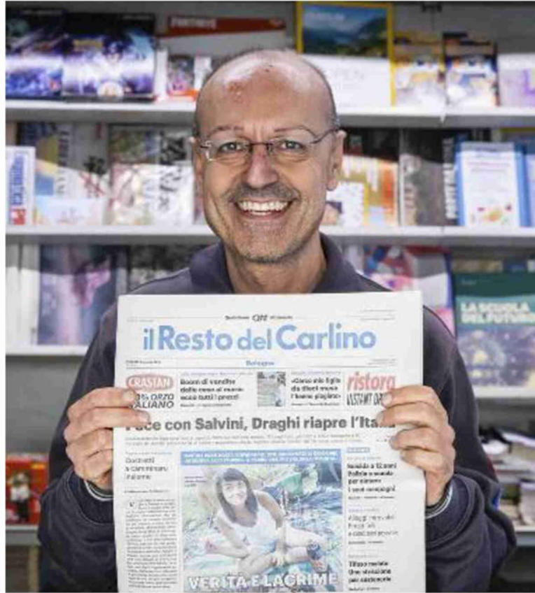
Tutti gli edicolanti di fiducia, sempre disponibili, anche nel weekend