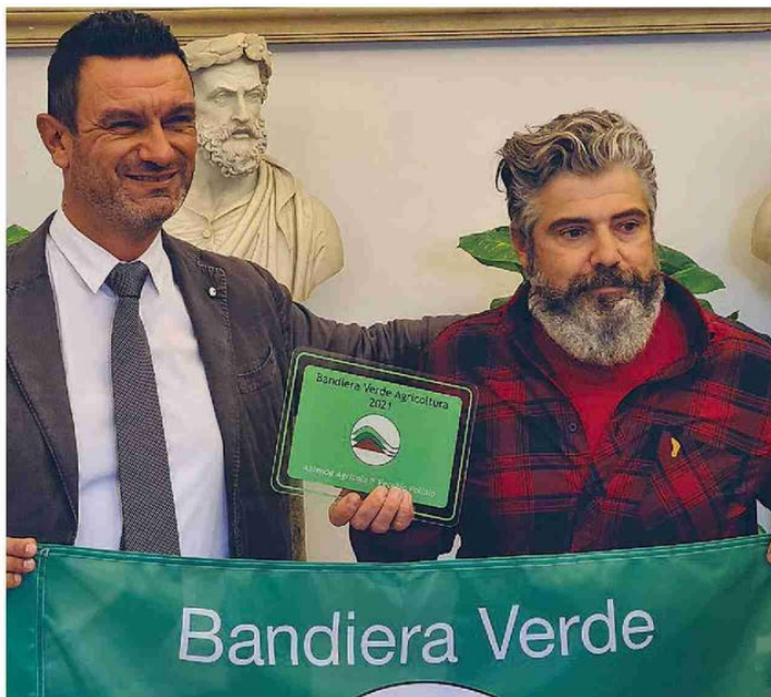
CONSEGNA DEL RICONOSCIMENTO "BANDIERA VERDE AGRICOLTURA 2021"

"campione dei campioni" fra tutti i premiati di quest'edizione, l'Azienda Agricola "Magisa" che dal 2004 esalta le qualità organolettiche del riso coltivato nella Piana di Sibari, in provincia di Cosenza, lavorato con sistema del tutto artigianale e gestendo l'intero ciclo della filiera per un alimento unico e meritevole di brevetti esclusivi per la Calabria.