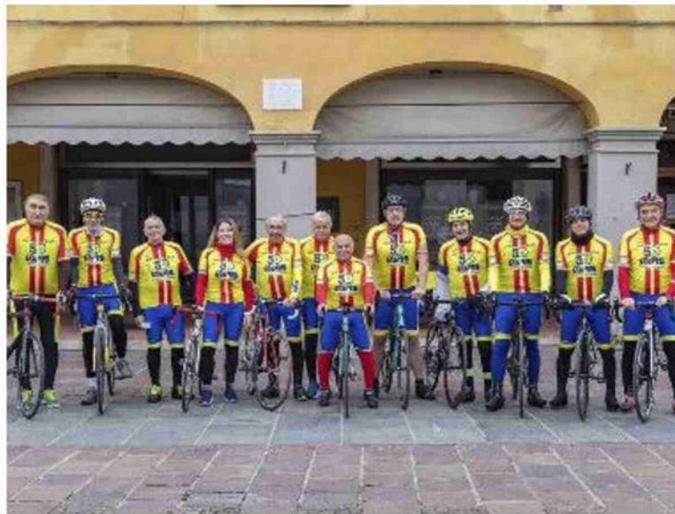
La Società ciclistica Avis di San Pietro in Casale