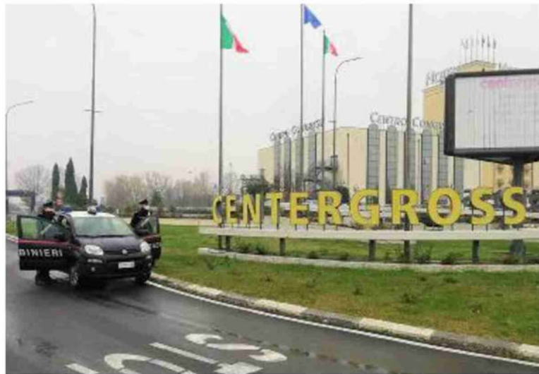
I carabinieri sono intervenuti al Centergross per la serie di furti