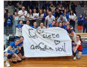
La Fenix festeggia la promozione in C