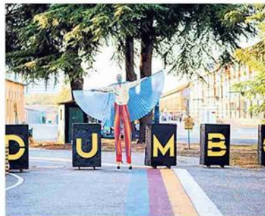
▲ Il luogo Il Dumbo in via Casarini

Non solo live. Il 12 maggio, l'8 e 9 giugno torna il vintage di Rail Market, mentre l'Università di Bologna ha deciso di portare qui, il 31, lo Startup day, quest'anno dedicato alla sostenibilità. Info: dumbospace.it - s.cam.