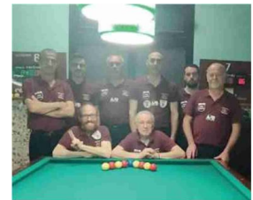
La squadra della Coop Rigenera Gatto Azzurro

Il turno di ritorno è infatti in programma stasera.