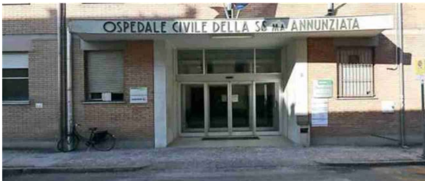
L'ospedale Santissima Annunziata di Cento