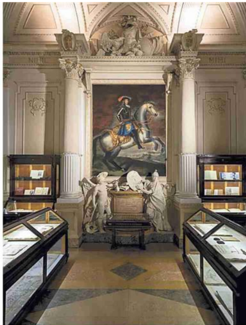
▲ Biblioteca Universitaria Palazzo Poggi