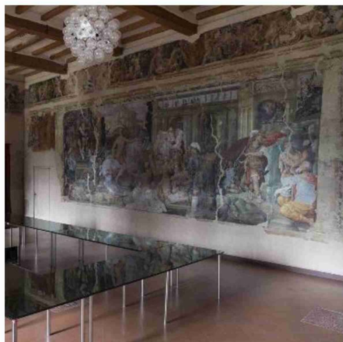
Un interno della Palazzina della Viola, integrata nel complesso di Filippo Re

Si svela anche a palazzo d'Armi Marescalchi, sede della Sovrintendenza delle Belle Arti