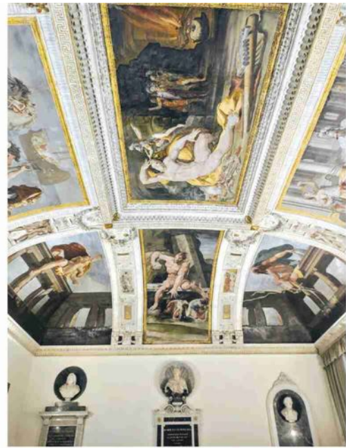
▲ Rettorato Palazzo Malvezzi Ca' Grande