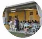
Lo stand allo stadio Una delle recenti edizioni della Maccheronata per i papà