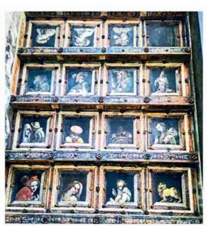
▲ Palazzina della Viola Nel verde dell'Orto Botanico

A Bologna si potrà visitare anche Palazzo Dall'Armi Marescalchi, sede della Sovrintendenza in via IV Novembre. «Come ogni anno, il Fai dell'Emilia-Romagna, che svolge un ruolo di educazione dei cittadini e di rispetto di questi beni, ha il merito di portarci alla scoperta delle bellezze di questa regione», chiude l'assessore Mauro Felicori.