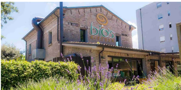
Il locale in cui sorgeva il ristorante Bio's Kitchen in via Della fiera