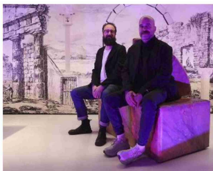
Qui sopra i sotterranei di Palazzo Bentivoglio per 'Post-Ruins Bentivoglio' di Andreas Angelidakis . In basso Sissi e i suoi 'Sacri Indici' al LabOratorio degli Angeli