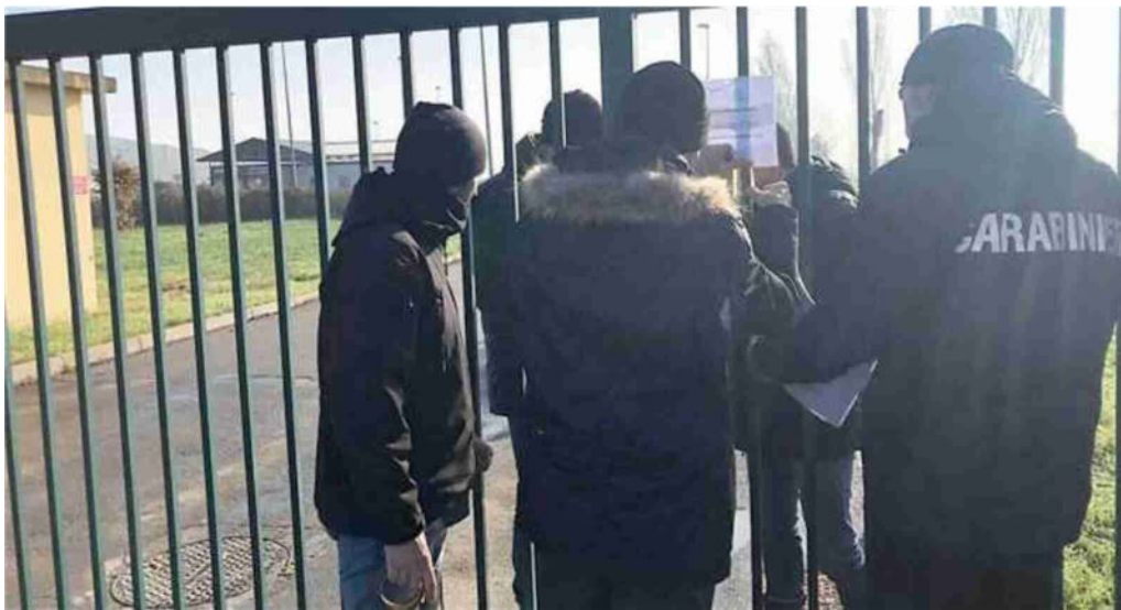
I carabinieri mentre mettono i sigilli alla discarica durante la complessa fase d'indagine

Comune soddisfatto: «Passo importante» Difesa agguerrita: «Operato corretto»