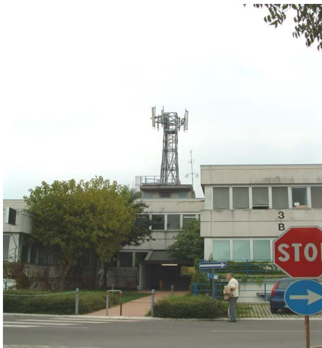
Figura 1: Panoramica dall'interno del Centergross.