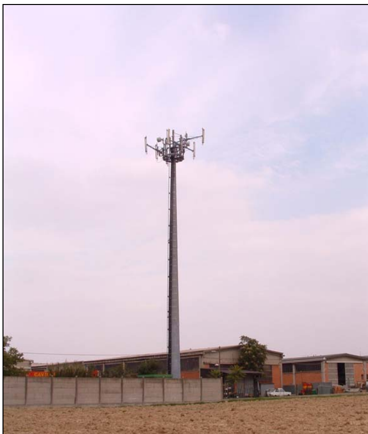
Figura 1: Panoramica in direzione N. La cabina rimane nascosta dal muro perimetrale.