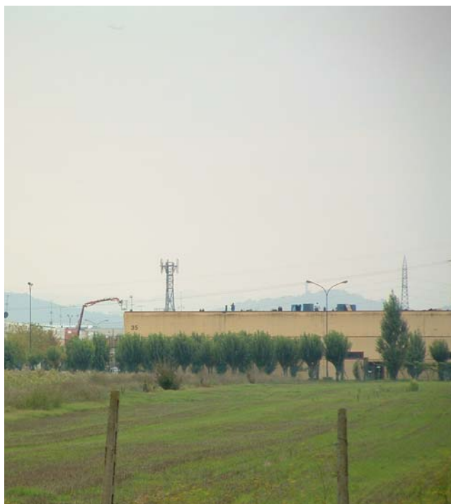
Figura 2: Panoramica dalla SP trasversale di pianura, direzione SE. Sullo sfondo è visibile l'edificio, all'interno del Centergross, che ospita la stazione radio base.