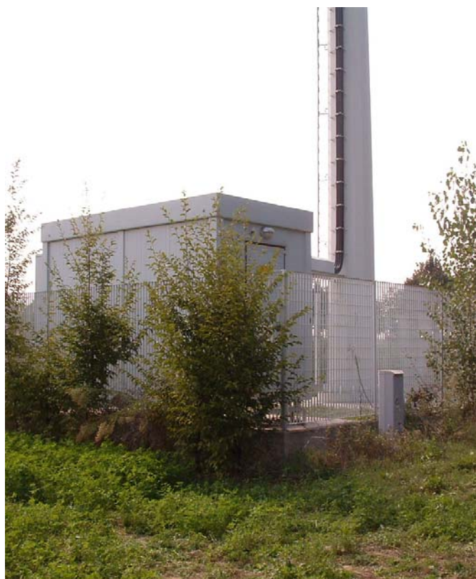
Fig.2 : particolare della vegetazione perimetrale