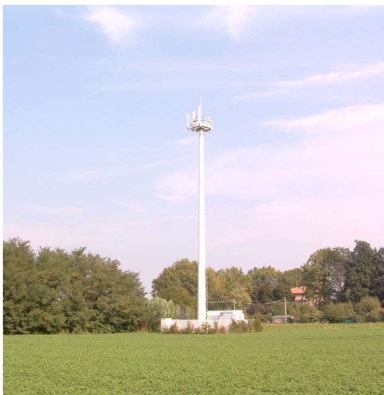
Fig. 1: panoramica della stazione radio base in direzione N-E