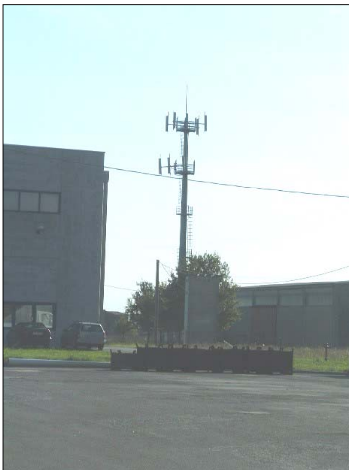
Figura 1: panoramica della Stazione Radio Base