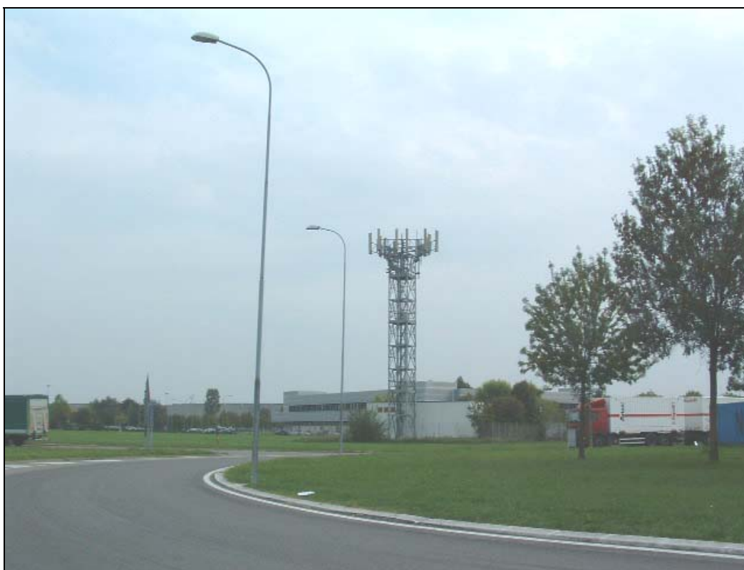
Figura 1: Panoramica dall'interno dell' Interporto in direzione NE. L'impianto è costituito da un traliccio di grandi dimensioni, molto impattante dal punto di vista paesaggistico.