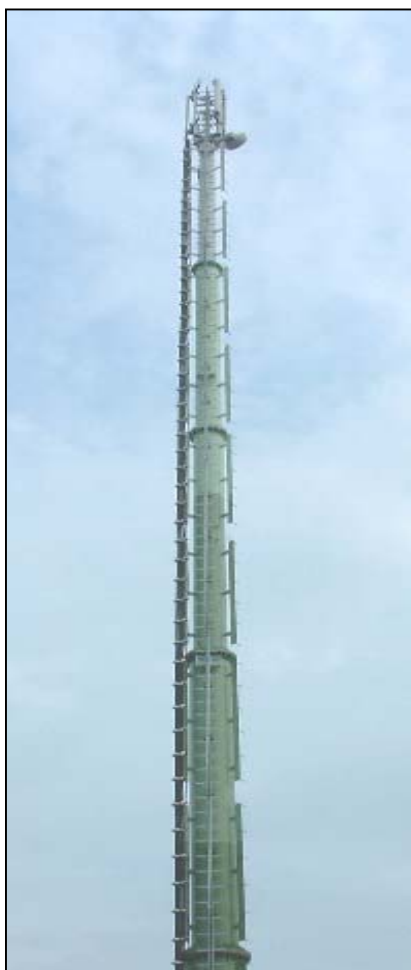
Esempio di palo con cromatismo verde a tonalità decrescente