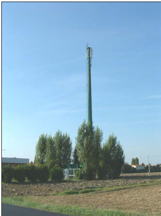
Figura 1: Panoramica in direzione O. La stazione radio base risulta essere ben mitigata da una siepe perimetrale di Populus Nigra variazione italica e da una siepe di Prunus Lauroceraso .