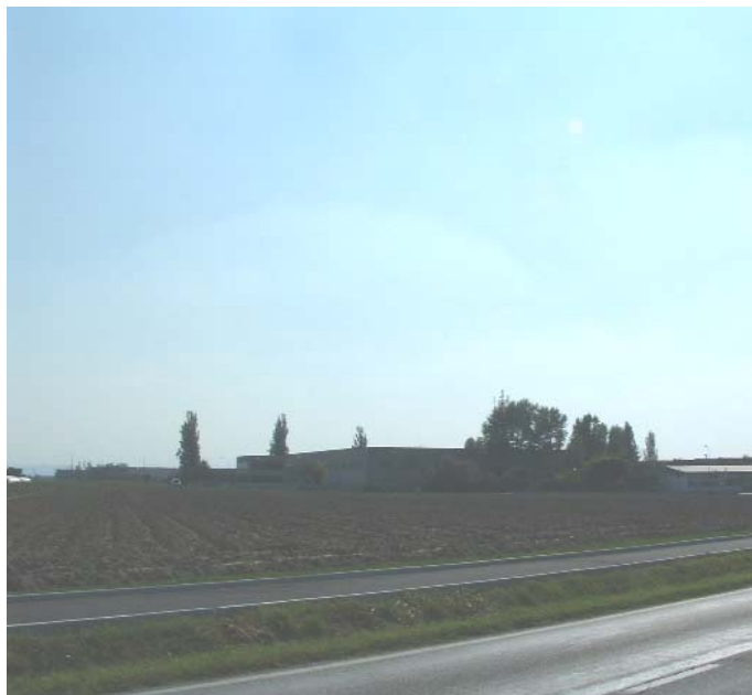
Figura 2: Panoramica dalla strada provinciale in direzione SO. Il sito rimane nascosto dalla vegetazione esistente di pertinenza dell'area produttiva