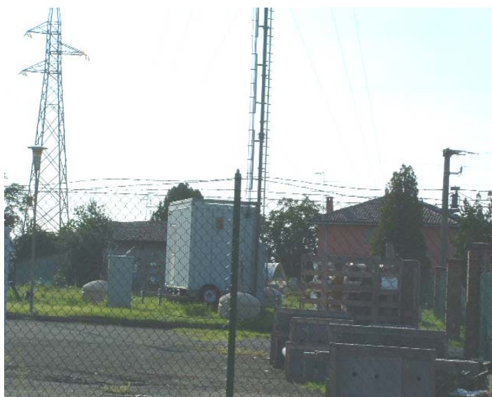
Figura 2 Panoramica da via Stagni in direzione O, sulla sfondo la cabina all'interno della cabina primaria dell'ENEL