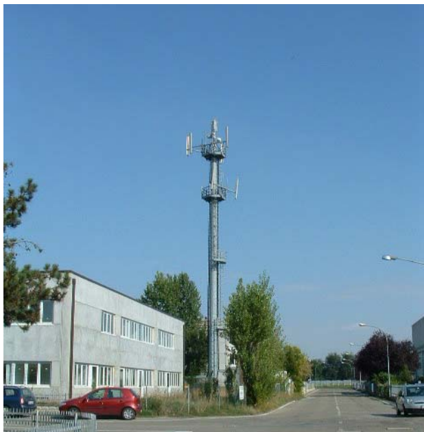
Figura 1: Panoramica da via degli Operai in direzione E. L'impianto è in parte nascosto dagli esemplari di pioppo esistenti lungo il perimetro dell'azienda che ospita la stazione radio base.