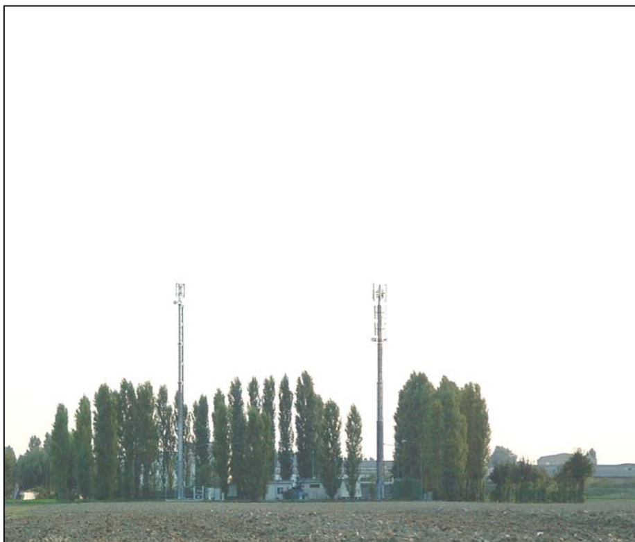
Figura 1: Panoramica in direzione S da via G.Marconi. Sullo sfondo le stazioni radio base esistenti in parte mitigate dalle quinte arboree dell'impianto di depurazione delle acque.