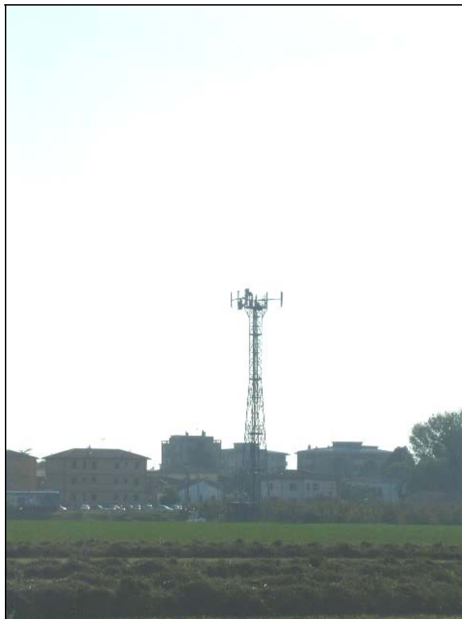
Figura 1: Panoramica in direzione SO da via Rubizzano, stazione radio base a sedime della linea ferroviaria