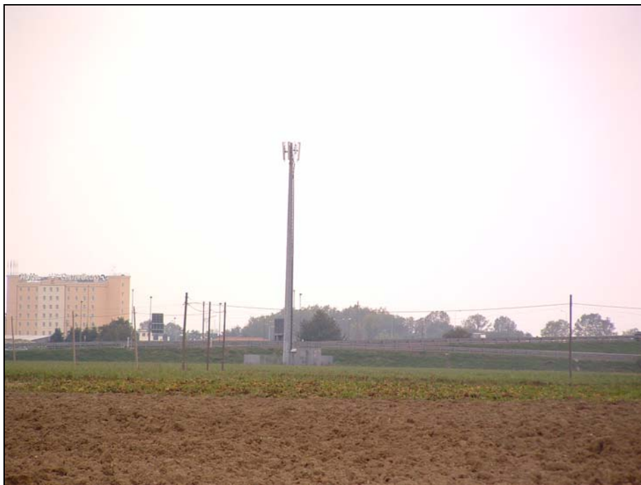
Figura 1: Panoramica della stazione radio base in direzione SO