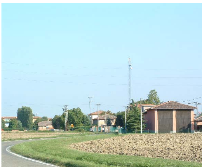
Figura 1: Panoramica da via Stagni in direzione E, sulla destra il sito n°6, sulla sinistra il sito n° 5.