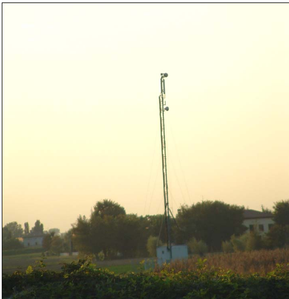
Fig 1: Panoramica della stazione radio base in direzione O.