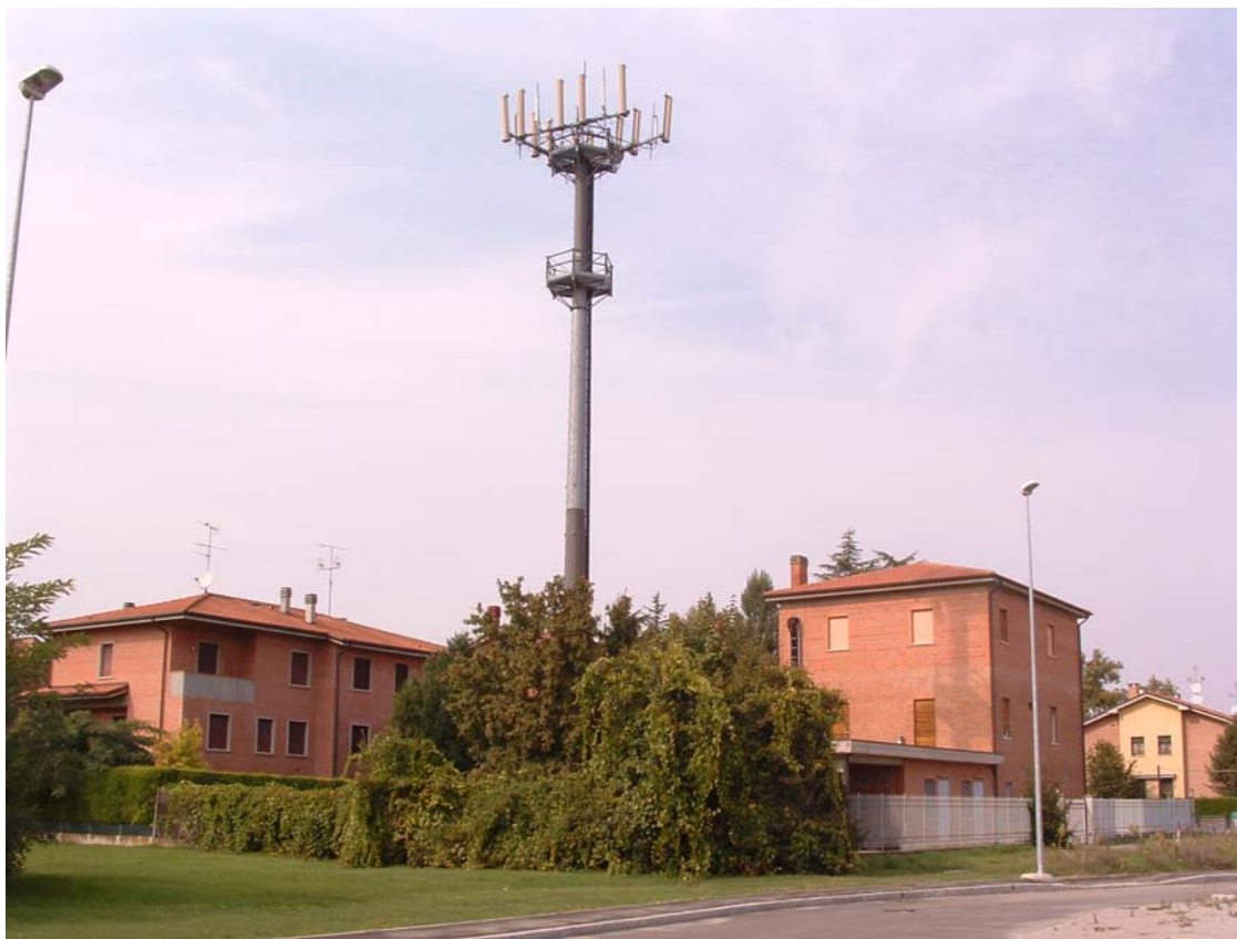
Figura 1: panorama della stazione radio base