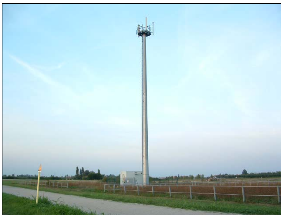
Figura 1: Panoramica in direzione Nord.